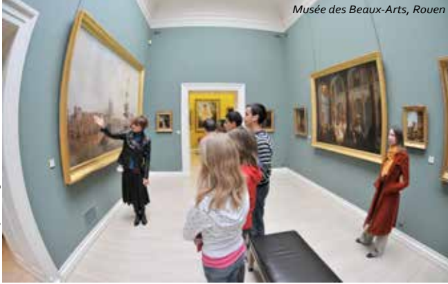
Musée des Beaux-Arts, Rouen