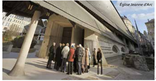
Église Jeanne d'Arc

Optez pour l'une des nombreuses visites guidées (Monument juif, Rouen et ses trésors...) ou libres proposées par Rouen Normandie Tourisme.