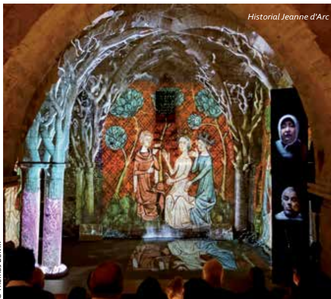
Historial Jeanne d'Arc

Situé sur les quais de Seine, le Panorama XXL est une invitation au rêve et une plongée au cœur de l'œuvre magistrale de l'artiste allemand Yadegar Asisi. Exposée jusqu'au 20 septembre, la fresque Rome 312 (plus de 35 mètres de haut) propose un voyage au cœur de la Rome antique.