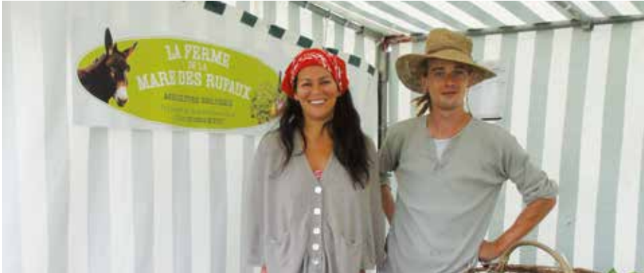
© La ferme de la Mare des Rufaux