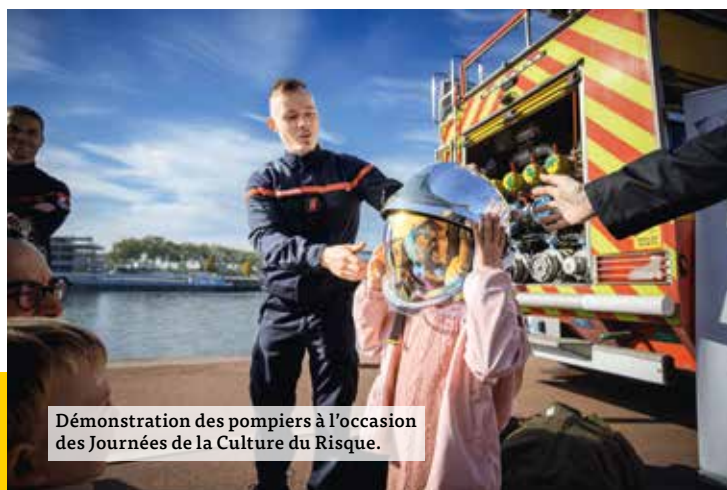
Démonstration des pompiers à l'occasion des Journées de la Culture du Risque.