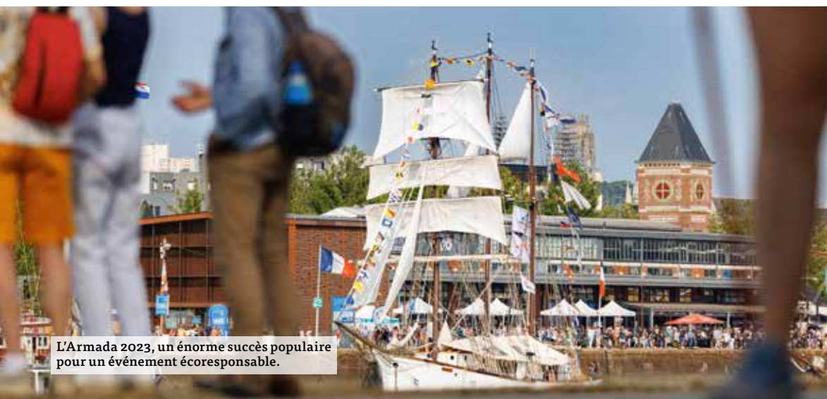
L'Armada 2023, un énorme succès populaire pour un événement écoresponsable.