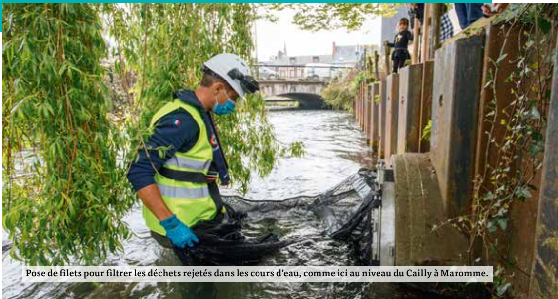
Pose de filets pour filtrer les déchets rejetés dans les cours d'eau, comme ici au niveau du Cailly à Maromme.