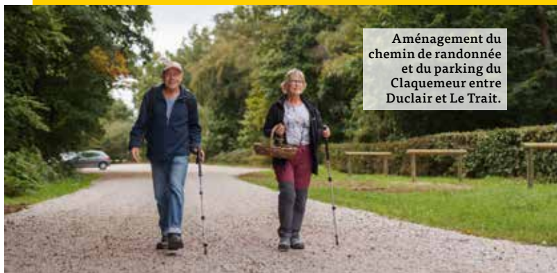
Aménagement du chemin de randonnée et du parking du Claquemur entre Duclair et Le Trait.