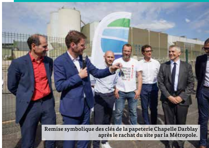
Remise symbolique des clés de la papeterie Chapelle Darblay après le rachat du site par la Métropole.

près de 10 M€ de soutien financier pour les PME/entreprises, associations, jeunes en recherche de stage. Aides au loyer, aides pour le télétravail, aides aux associations via les communes, aides pour les jeunes stagiaires