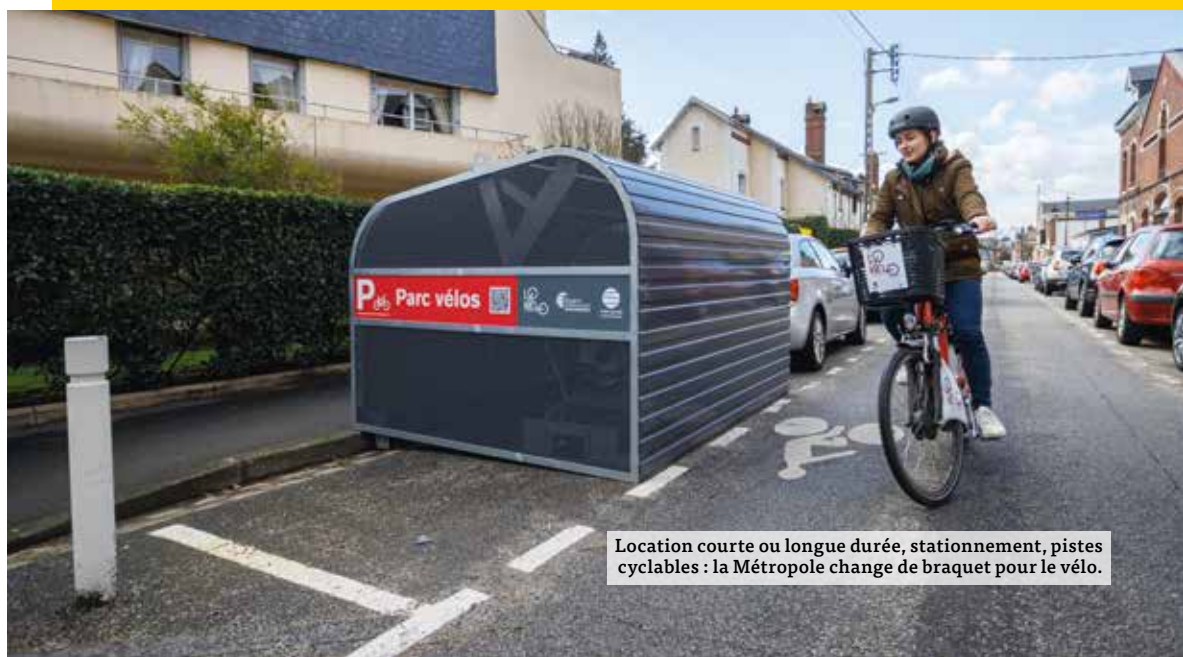
Location courte ou longue durée, stationnement, pistes cyclables : la Métropole change de braquet pour le vélo.