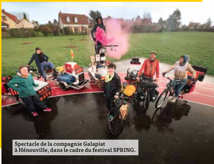
Spectacle de la compagnie Galapiat à Hénouville, dans le cadre du festival SPRING.