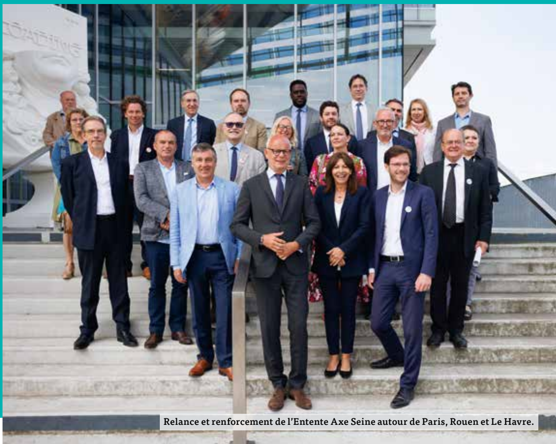
Relance et renforcement de l'Entente Axe Seine autour de Paris, Rouen et Le Havre.

• Initiée par la Métropole Rouen Normandie, la Ville de Paris, la Métropole du Grand Paris et la Communauté urbaine Le Havre Seine Métropole, l'Entente Axe Seine est un outil de coopération territoriale destiné à accélérer le développement des projets liés à la transition écologique, énergétique et économique. Depuis juin 2023, l'Entente est composée de 16 collectivités qui dessinent une continuité territoriale complète entre Paris et Le Havre pour le