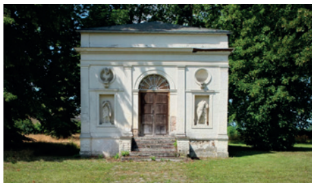
Théâtre du château , Martot

Le château de Martot a eu plusieurs vies. Construit à partir de 1734 par le seigneur de Boucourt, il est racheté cent ans tard par un important manufacturier local : M. Grandin de l'Eprevier. Passant de mains en mains, il devient dans les années 1950, un pensionnat pour jeunes filles. A la fin des années 1970, l'hôpital d'Elbeuf en fait une maison de retraite avant qu'il ne soit racheté en 1999 par l'actuelle communauté d'agglomération Agglo Seine Eure qui l'a fait restaurer. Il sert aujourd'hui de lieu de réceptions et séminaires.