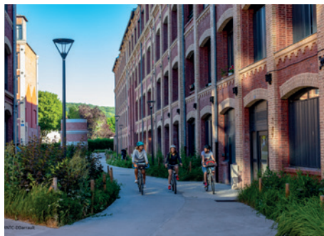
Quartier Blin & Blin