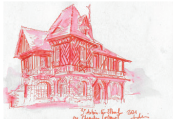
Hélène Moinerie, Saint-Aubin-lès-Elbeuf, aquarelle et feutre, avril 2021

En retournant à la gare de Saint-Aubin, saurez-vous localiser cette belle maison ?