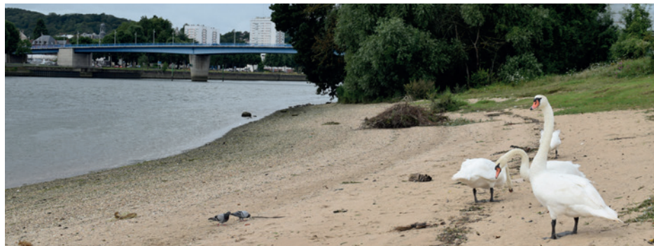
Plage aux cygnes