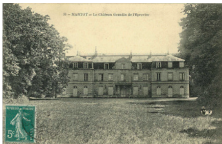
Château Grandin de l'Eprevier, Martot , carte postale © Archives départementales de l'Eure, 8 Fi 394-3.