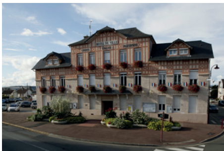
Mairie de Saint-Pierre-lès-Elbeuf