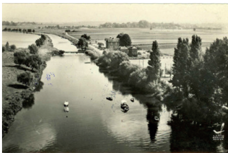
La Seine à Martot, carte postale © Archives départementales de l'Eure, 8 Fi 394-11.