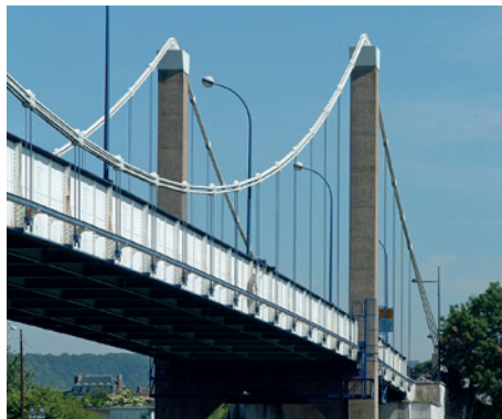
Pont Guynemer, Elbeuf