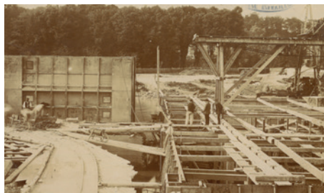
La construction des écluses de Saint-Aubin,