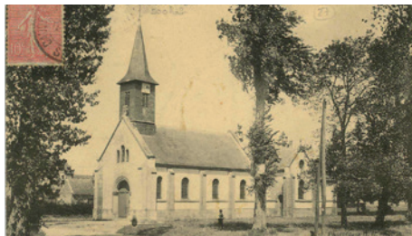
L'église Saint-Aignan, Martot, carte postale © Archives départementales de l'Eure, 8 Fi 394-2.

Sur la route qui rejoint la Seine, le village conserve de nombreux corps de ferme typiques avec leurs hauts murs de pierre et leurs entrées charretières.