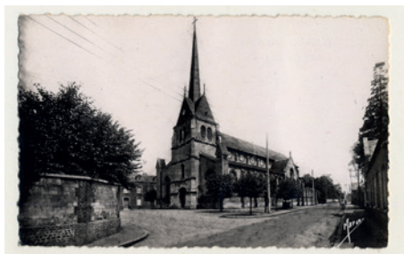
Église Saint-Aubin, carte postale. © Archives départementales de Seine-Maritime, 20 Fi _ Saint-Aubin_002