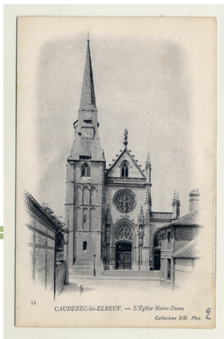
Église Notre-Dame , carte postale © Archives départementales de Seine-Maritime, 20 Fi_Caudebec_003