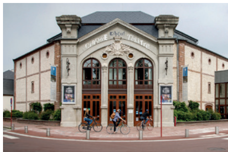
Façade du cirque-théâtre