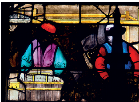
Tisserands , verrière (détail), église paroissiale Saint-Etienne d'Elbeuf.