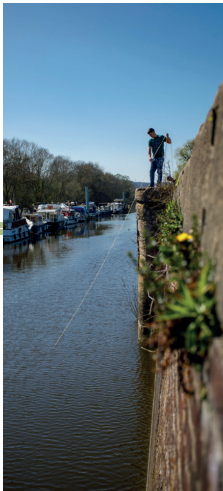
Port de Plaisance de Saint-Aubin.