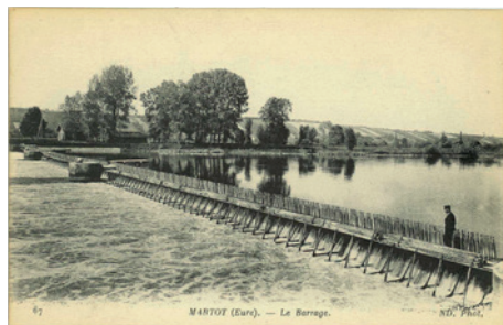
Le barrage de Martot, carte postale

© Archives départementales de l'Eure, 8 Fi 394-7.