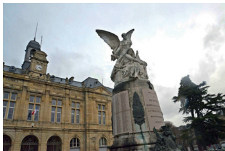
Hôtel de Ville et monument aux morts d'Elbeuf