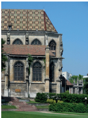
Chevet de l'église Saint-Etienne.

Surplombant l'ancien quartier du Puchot, l'église Saint-Etienne est construite à partir du 15 e siècle. Il s'agissait de la paroisse primitive du bourg d'Elbeuf. Bénéficiant de la magnificence des seigneurs d'Elbeuf mais aussi des corporations, elle bénéficie d'un très bel ensemble de vitraux (16 e siècle) et d'un décor baroque (18 e siècle). Ses tuiles vernissées colorées ont été restituées mais rappellent l'usage courant de ce matériau dans la vallée de la Seine au Moyen Âge.