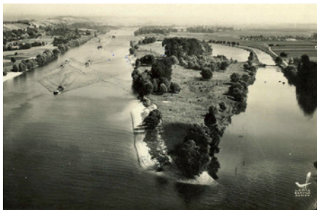
La Seine à Martot, carte postale © Archives départementales de l'Eure, 8 Fi 394-4.

C'est ici que se marient les eaux de la Seine et de l'Eure. A l'origine la confluence se trouve en amont mais les travaux de 1934 ont rallongé d'une dizaine de kilomètres l'Eure, séparée du fleuve par une digue artificielle.