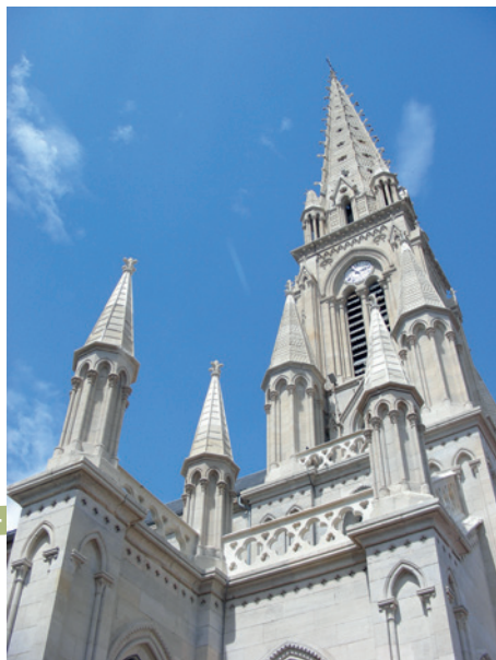
Église de l'Immaculée Conception

N'hésitez pas à vous arrêter en toute sécurité pour profiter de la visite des lieux.