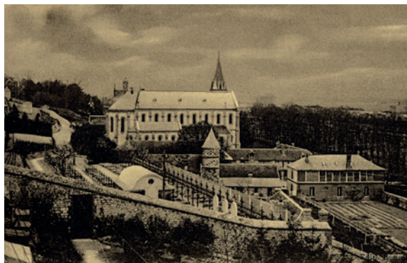
Couvent des sœurs du Sacré Cœur avec, au premier plan, le cimetière des sœurs,