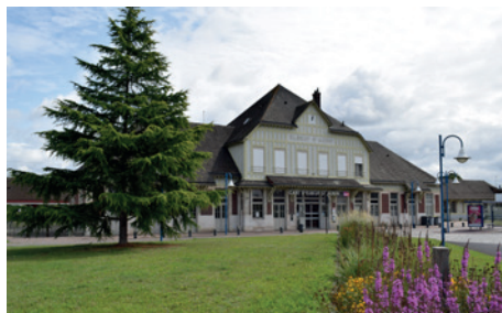
Façade de la gare