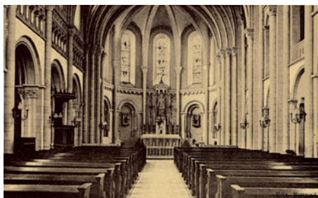
Intérieur de l'église, carte postale.

Non loin, en poursuivant le chemin qui vous mènera au pont, vous pourrez apercevoir à droite le Château des Terrasses, également à flanc de colline. De style néo-classique il a été construit au début du 19 e siècle par un drapier local. Sa pierre jaune, sa toiture plate et ses terrasses descendant vers la Seine lui donnent l'aspect d'une villa italienne.