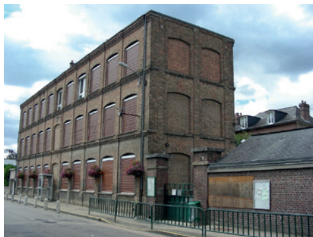
Usine Revel

L'église a plusieurs particularités. La plus visible est la devise républicaine « Liberté-Egalité-Fraternité » apposée sur son fronton durant la III e République. La seconde est son orientation inversée : le chœur regarde vers l'Ouest ! Si l'église conserve un clocher du 12 e siècle et des parties du 16 e siècle, l'essentiel fut reconstruit par notre fameux Barthélémy. L'intérieur présente un décor complet représentatif du néogothique développé par cet architecte : il fut le premier à construire une église intégralement dans ce style à Bonsecours près de Rouen en 1839.