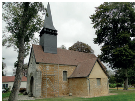
La chapelle du château, Martot.