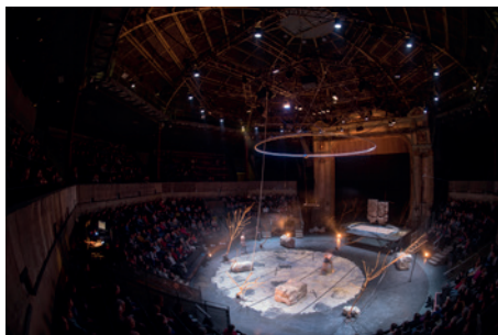
Intérieur du cirque-théâtre