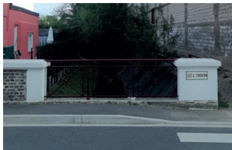
La rivière Oison canalisée