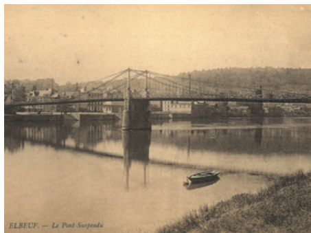
Pont suspendu, Elbeuf carte postale. Fabrique des Savoires, centre d'archives patrimoniales, 2 Fi 445, Elbeuf. © Réunion des Musées métropolitains.