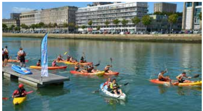
Première édition des Jeux Normands au Havre en septembre 2015.