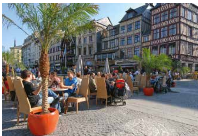
La place du Vieux-Marché.

Cette politique globale est complétée par des actions pour faire de la Métropole une importante destination de tourisme d'affaires : rénovation du Parc Expo achevée en 2015, montée en puissance du Bureau des conventions, soutien à la réalisation du nouveau Palais des Congrès porté par la Matmut.