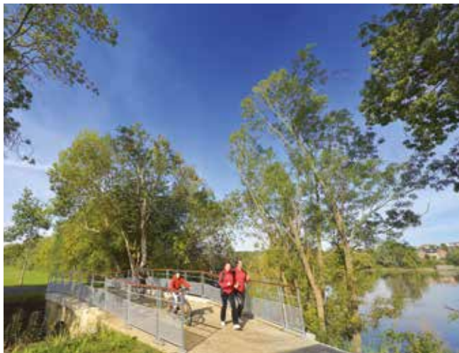
Trame bleue et trame verte pour les modes doux de déplacement.

Mise en œuvre à travers le Plan de déplacements urbains (PDU, approuvé en décembre 2014), la politique de la mobilité constitue le principal levier pour faire reculer l'usage de la voiture individuelle. Outre le développement des infrastructures, l'attractivité des transports en commun tient aussi à d'autres facteurs : performance et fiabilité du service (avec la modernisation des systèmes d'information aux voyageurs, des aménagements sur les lignes), l'accessibilité (avec des travaux sur les stations de bus et les gares, tarification solidaire parmi les plus avancées de France), des transports plus agréables, grâce à la modernisation régulière du service, qu'il s'agisse du matériel ou des équipements.