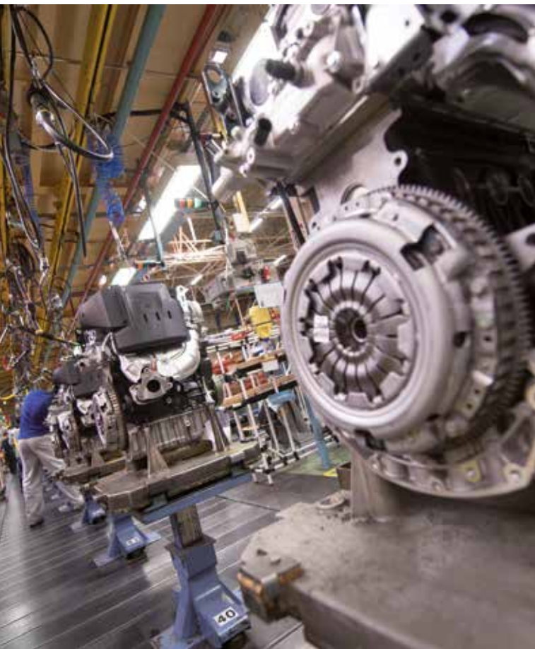
L'usine Renault Cléon produit les moteurs électriques du constructeur.

d'animation. La totalité des zones sera desservie par la fibre optique en 2020. En outre, un effort particulier devra être consenti pour améliorer la qualité de leurs voiries.