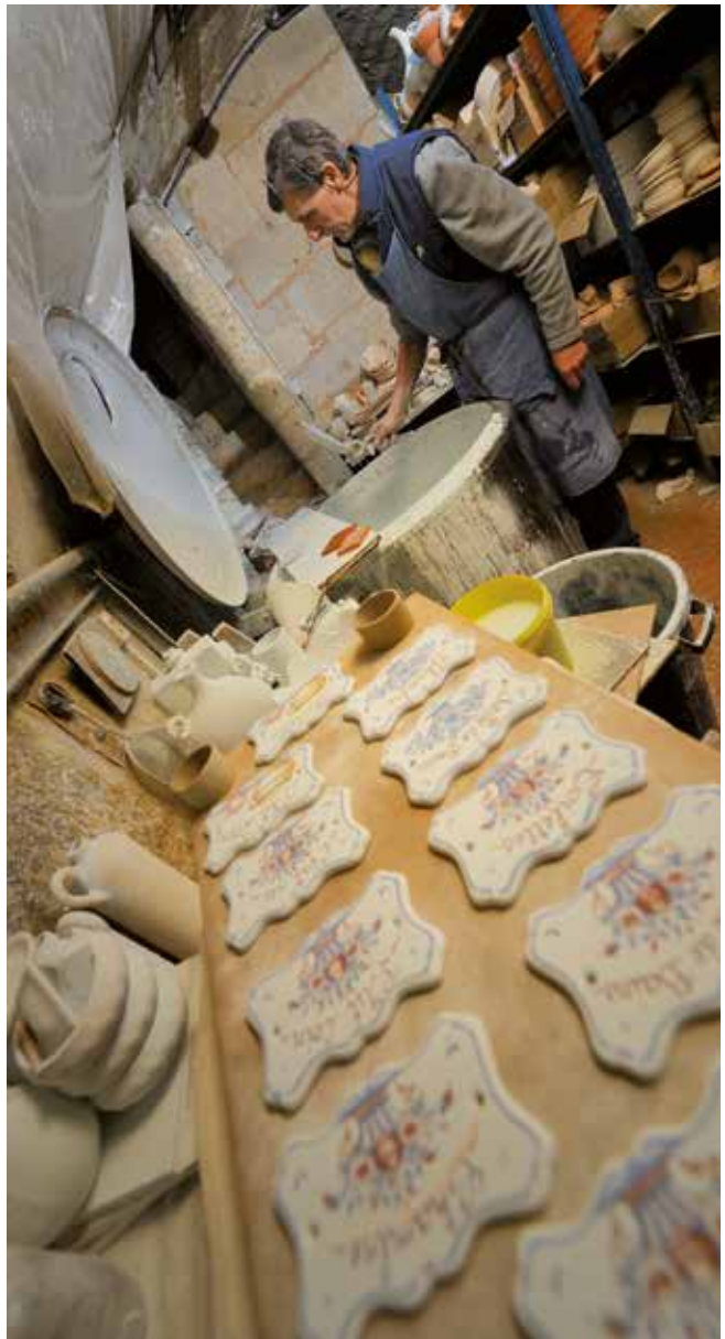
L'artisanat d'excellence, une vitrine de la créativité de la métropole.

Le secteur touristique présente un important potentiel pour le développement de l'emploi local, encore sous-exploité aujourd'hui, avec 5 000 emplois directs et 210 millions d'euros de retombées économiques chaque année. Il faudra faire fructifier ce potentiel en poursuivant la politique globale de développement touristique afin de faire de la métropole rouennaise une destination touristique européenne de premier plan (voir page 29).