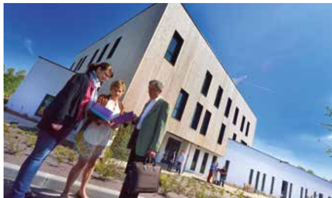
Seine Écopolis, pépinière d'entreprises dédiée à l'écoconstruction.