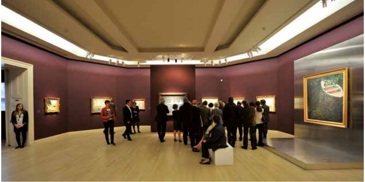
Normandie Impressionniste au Musée des Beaux-Arts de Rouen.