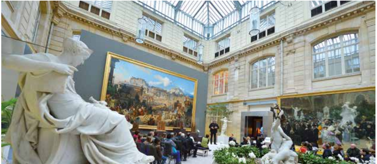
Le jardin des sculptures du Musée des Beaux-Arts.

Facteur de rayonnement, le tourisme est un enjeu économique de première importance : les retombées sur le territoire sont estimées à 210 millions d'euros chaque année, et environ 5 000 emplois sont directement liés au secteur touristique. L'objectif est d'attirer un million de touristes supplémentaires après 2020. En installant une identité forte autour des richesses de son patrimoine, de la beauté de ses paysages et des grands symboles du territoire (Jeanne d'Arc, l'Impressionnisme), la métropole se positionne à la fois comme une destination prisée pour les courts séjours, l'étape centrale des grands circuits touristiques du nord-ouest de la France et une destination d'exception lors de grands événements de rayonnement national et international.