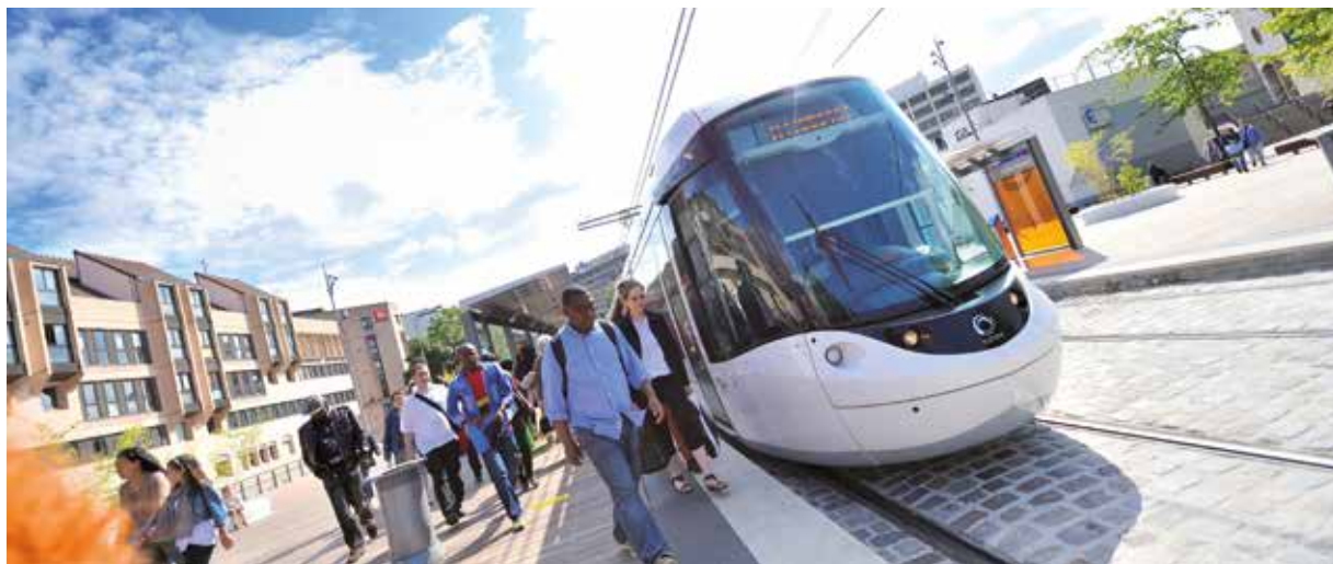
Le métro à Saint-Sever.

Conforter le rôle structurant des transports en commun, c'est aussi favoriser l'intermodalité à travers des aménagements spécifiques. Déjà engagé, ce travail sera poursuivi dans les prochaines années : aménagement des abords des gares de façon à