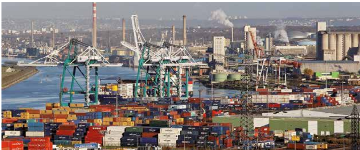
Poumon économique du territoire, le Port est un partenaire quotidien de la Métropole.