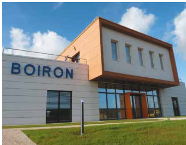
Le laboratoire Boiron, l'un des pionniers de la Plaine de la Ronce.

Seine Cité articule un pôle Ouest autour des écoquartiers Flaubert rive gauche et Luciline rive droite, et un pôle Est avec un centre d'affaires au sein du quartier multifonctionnel qui verra le jour à horizon 2030 autour de la nouvelle gare régionale à Rouen Saint-Sever. Grâce à une desserte performante par les transports en commun (métro, ligne F1, nouvelles lignes en site propre...), ces nouveaux quartiers mixtes, intelligents et à haute performance