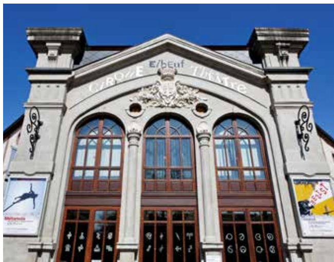
Le Cirque-Théâtre d'Elbeuf.