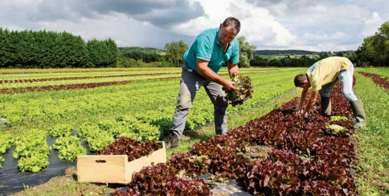
La Métropole soutient son agriculture et développe les circuits courts.

énergétique fonctionneront en synergie entre eux, avec le centre historique, les quartiers de la rive gauche (avec des interventions complémentaires pour moderniser le quartier Saint-Sever) et l'ensemble de la métropole.