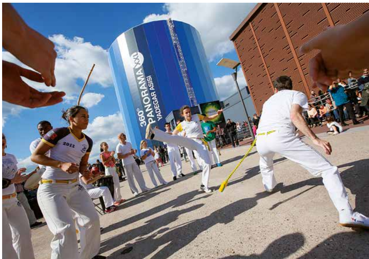
Le Panorama XXL.

Ces équipements sont complétés par une offre d'animations d'une grande richesse qui va des manifestations de nature jusqu'à l'animation et la valorisation du patrimoine dans le cadre du label Ville et Pays d'Art et d'Histoire, en passant par le festival Graines de Jardin, le Curieux Printemps, les Visites d'ateliers d'artistes... Ces manifestations ont vocation à faire essayer les actions culturelles dans les communes, en lien avec et en complément de l'offre existante, dans une démarche de valorisation des talents locaux. La Métropole soutient ou accompagne certaines manifestations exigeantes et populaires portées par les communes qui rayonnent au niveau régional ou national (VivaCité à Sotteville-lès-Rouen, Festival de Rouen du livre de jeunesse...), ainsi que des événements sportifs de premier plan (Meeting international d'athlétisme de Sotteville-lès-Rouen) et des clubs de niveau national.