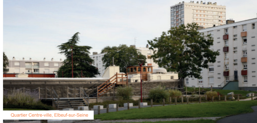
Quartier Centre-ville, Elbeuf-sur-Seine

Désormais, pour identifier les quartiers prioritaires, un critère unique est observé : le revenu des habitants.