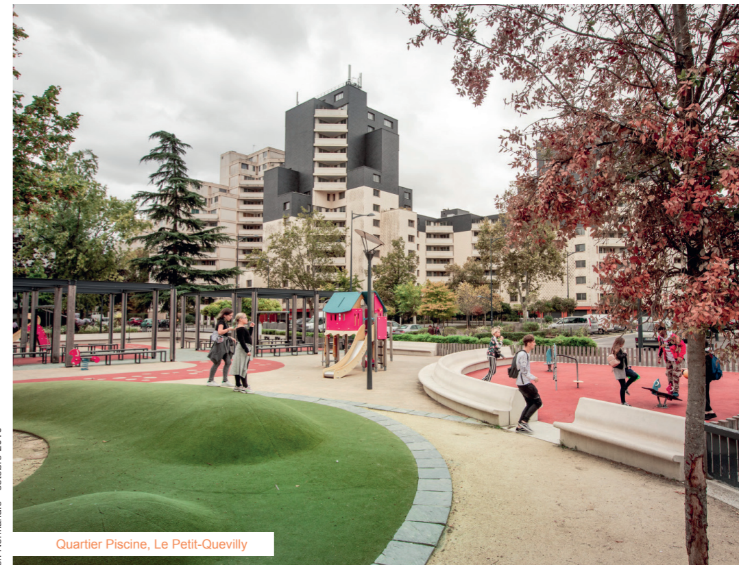
Quartier Piscine, Le Petit-Quevilly

Métropole Rouen Normandie - octobre 2019