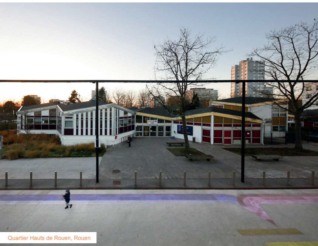
Quartier Hauts de Rouen, Rouen