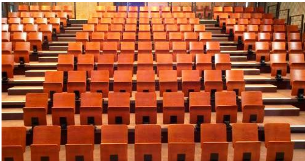
La pose de l'auditorium a nécessité trois jours de travail

Cet espace conférence qui pourra accueillir des séminaires d'entreprises, des congrès, des assemblées générales ou encore des conventions, sera directement relié aux halls d'expositions, aux salles de réunions et à l'espace restauration.