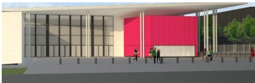
Nouveau visage de l'entrée du Parc des Expositions

L'accès à cet équipement phare de la Métropole se fera ainsi par trois entrées visiteurs distinctes, permettant la tenue de trois événements en simultanément au Parc des Expositions.