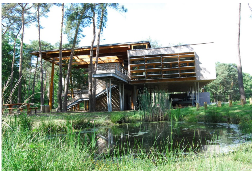
Maison des Forêts de Saint-Etienne-du-Rouvray

Plus d'infos : www.metropole-rouen-normandie.fr/maisons-des-forets-de-la-metropole