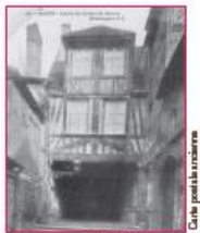
Le passage Sud début XX*