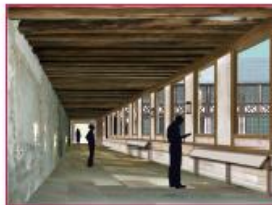
Le passage piétonnier couvert de l'aile Ouest