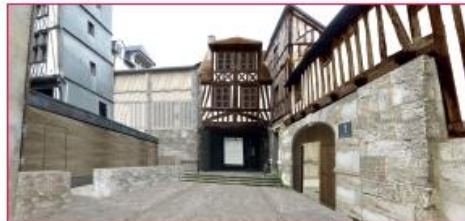
Le passage Sud d'accès à l'Âtre après restauration des bâtiments