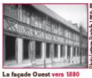
La façade Ouest vers 1880