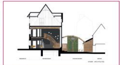
Vue de coupe de l'espace de restauration avec vue de laarrière de la cour des prêtres