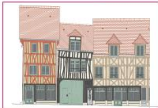
Les façades sur la rue Martainville après travaux