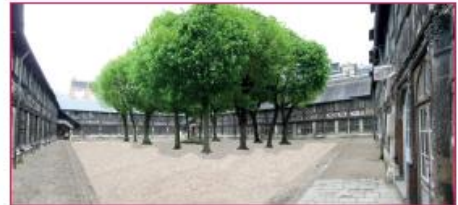
La cour centrale après restauration avec ses arbres et son calvaire