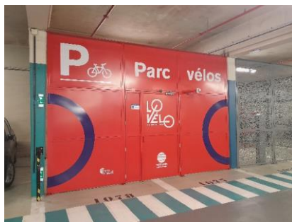
Parking Vieux Marché, Rouen