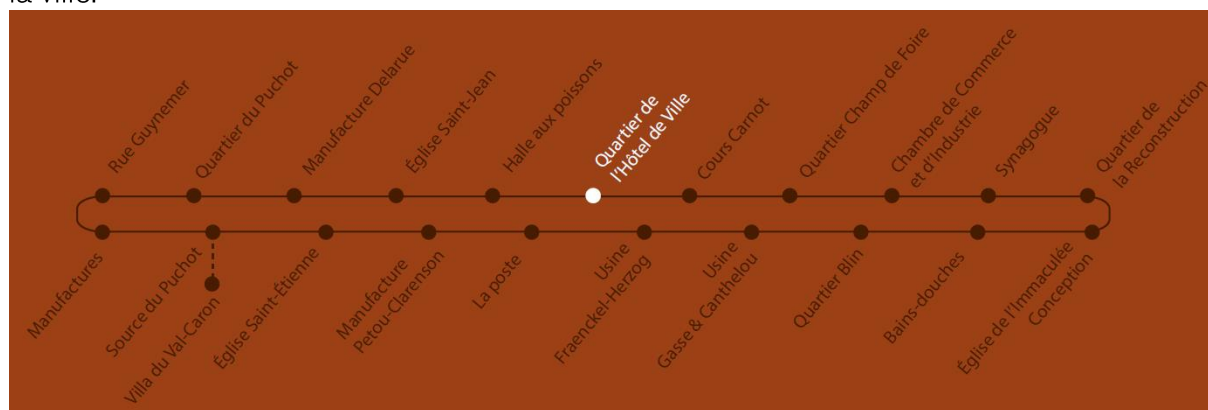
Extrait du panneau « Quartier de l'Hôtel de Ville » présentant l'ensemble des panneaux présents dans la ville

La couleur « brique » a été privilégiée pour s'intégrer au mieux dans le paysage elbeuvien. L'intégralité des panneaux est traduite en anglais et en allemand afin de favoriser leur appropriation par le plus grand nombre et de favoriser le tourisme dans la ville. Ces affichages peuvent se lire indépendamment mais permettent également de faire un circuit de découverte de la ville, chaque panneau indiquant l'ensemble des panneaux présents dans la ville.