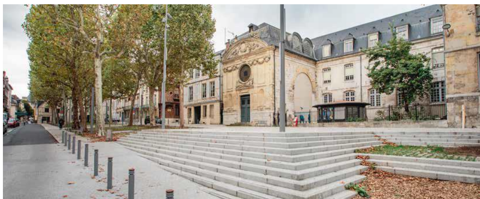
Place de la Rougemare - Alan Aubry - MRN

Riverains comme touristes ont pu largement profiter de l'embellissement des nouveaux espaces du secteur des Musées. La place de la Rougemare s'est dotée d'une magnifique esplanade devant le théâtre de la Chapelle Saint-Louis alors que l'Allée Eugène-Delacroix relie à présent le quartier des Musées au centre commerçant de Rouen.