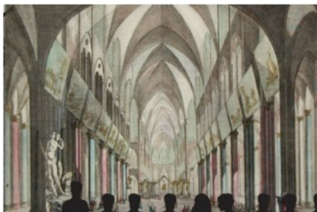
Mapping architectural (Crédits : Agence Clémence Farrel)

L'Historial accueillera quatre groupes par heure, d'une vingtaine de personnes chacun. Les visites seront commentées en français, avec une traduction via un audio-guide pour les visiteurs étrangers.