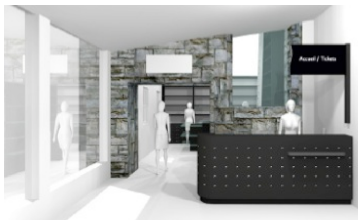
Projet d'aménagement de la zone d'accueil (Crédits : Agence Clémence Farrel)

La rigueur scientifique sera associée au pouvoir d'évocation des lieux pour proposer une visite à la fois accessible au plus grand nombre et d'une grande richesse documentaire.