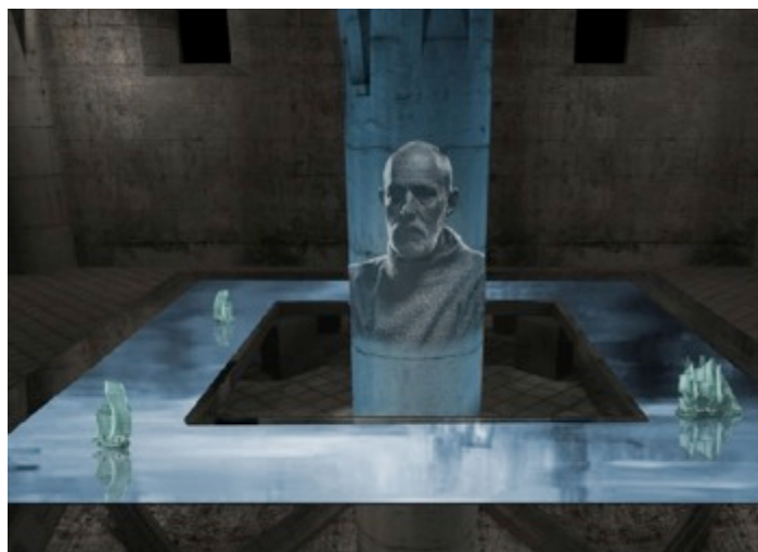
Exemples de dispositifs multimédia