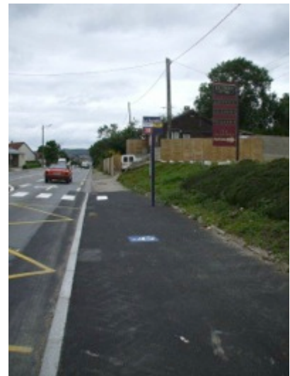
Après les travaux

Les travaux d'accessibilité consistent à aménager un quai de 18 centimètres de hauteur pour une largeur d'1,4 mètre afin de permettre l'accès des bus aux personnes à mobilité réduite. Le coût de cette opération pour la CREA est de 400 000 euros.