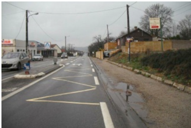
Le Trait – Arrêt La Bucaille vers Caudebec-en-Caux avant les travaux

Tous les arrêts de la ligne ont été ou vont être aménagés afin de permettre l'accès des bus aux personnes à mobilité réduite. Cela correspond à l'aménagement d'une cinquantaine de quais .