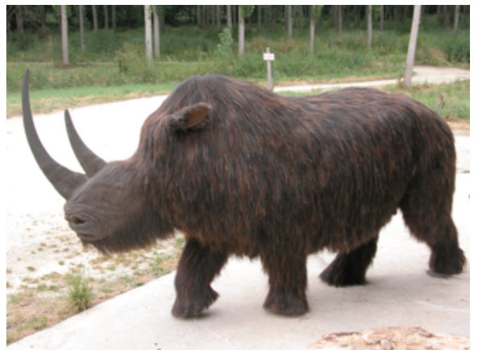
Rhinocéros laineux - reconstitution OPHYS.

Ces précieux vestiges du passé permettent aujourd'hui aux archéologues, géologues et paléontologues de reconstituer les environnements d'antan.