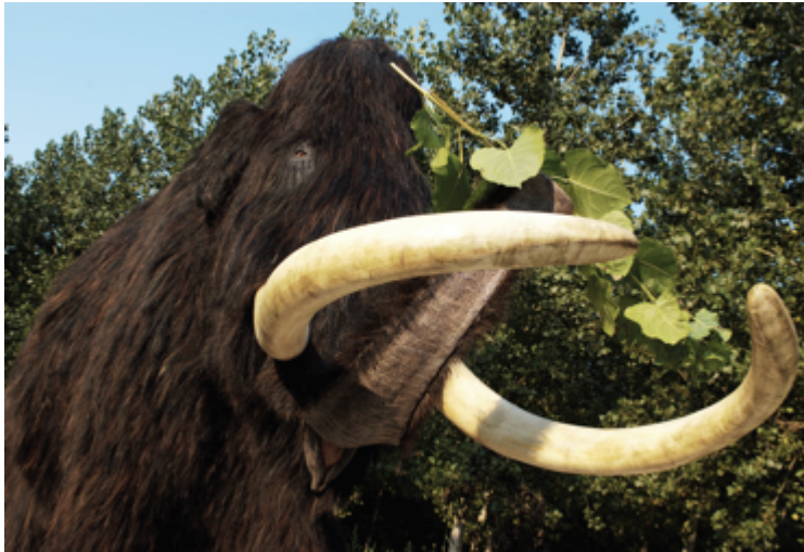
Mammouth laineux-reconstitution OPHYS

Les restes de mammouths, de rhinocéros laineux ou de lions des cavernes sont les témoins de l'évolution du climat et des paysages de la vallée de Seine, où se sont succédées des flores et des faunes très diverses.