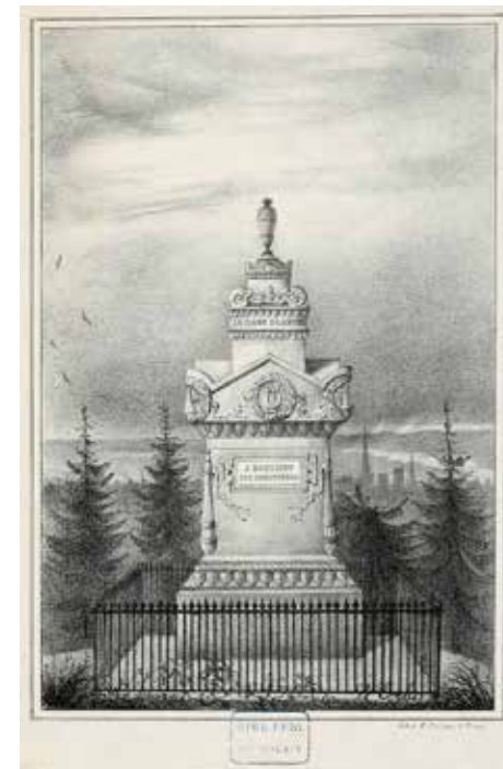
Nicéas Periaux, tombeau de Boieldieu , tiré de Revue de Rouen , estampe, milieu du 19 e siècle Bibliothèque municipale de Rouen, Est. topo. p 4264.

Avec l'arrivée du cœur de Boieldieu, la mode de se faire enterrer au Monumental est lancée!