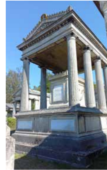
Le néo-classique : reprise de l'art antique avec colonnes, obélisques... (carré I2)

Stèle : pierre tombale placée verticalement. Cippe : petite colonne ou stèle cubique à usage funéraire dans l'Antiquité.