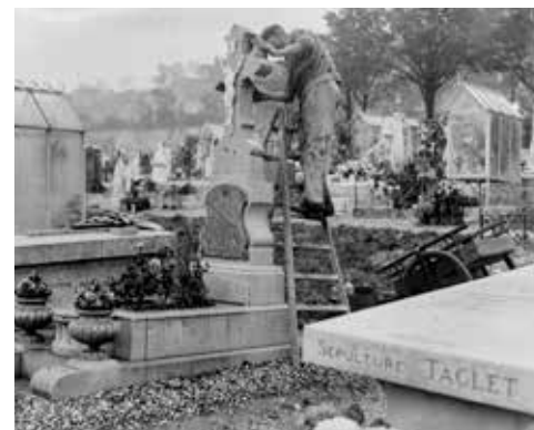
« La toilette des tombes », 1937, Archives départementales de Seine-Maritime (10 Fi 3515). Cimetière non-identifié.

Les entrepreneurs s'associent aux sculpteurs afin de produire des éléments d'architecture, mais aussi des statues et des bustes. La famille Devaux comprend ainsi les deux corps de métier. La production monumentale est également incarnée par les trois générations de la famille Foucher qui réalisent leurs propres sépultures (Carré H2 et Carré G2).