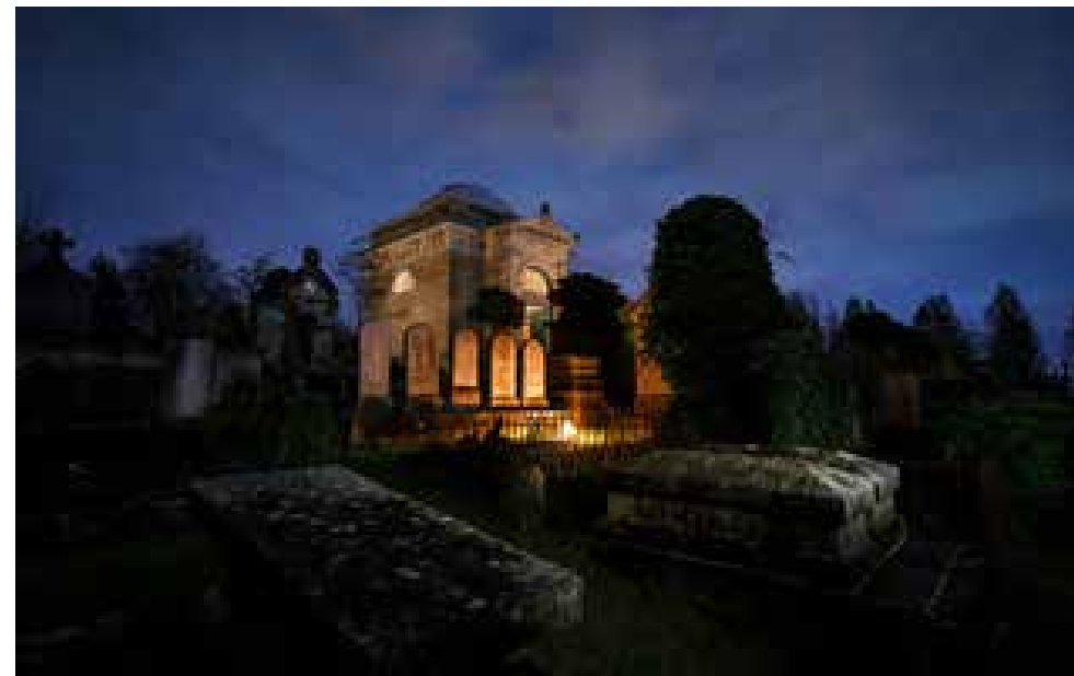
Ancienne chapelle © Alan Aubry – MRN.

Concession perpétuelle : emplacement dans le cimetière, cédé par la commune à une famille pour une durée illimitée.