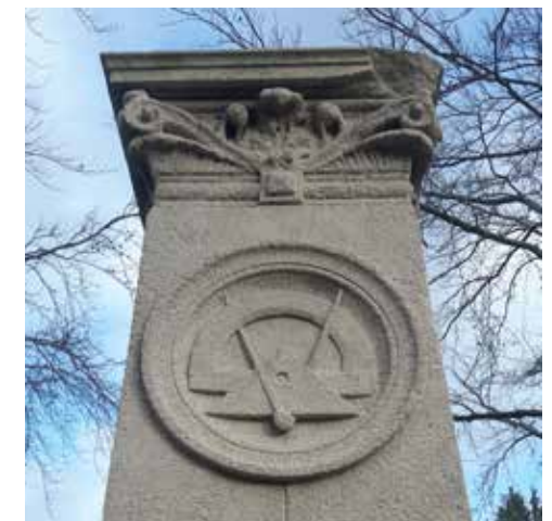
Sépulture Fourez, (carré E). Architecte : E. Fauquet.

Avant de s'éteindre, la mode des vitraux vit un dernier sursaut avec le style art déco à l'image des verrières de Georges Tambouret dans la chapelle Lafond en 1929.