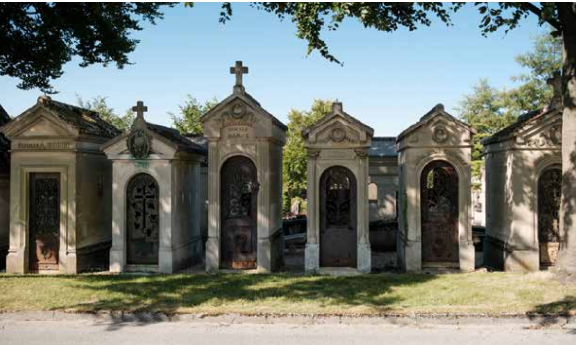
Carré D.