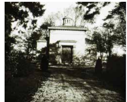
Robert Eude, crématorium , photographie, Archives départementales de Seine-Maritime, 11Fi2936.

Colombarium : étagères à niches, accueillant les urnes des défunts.