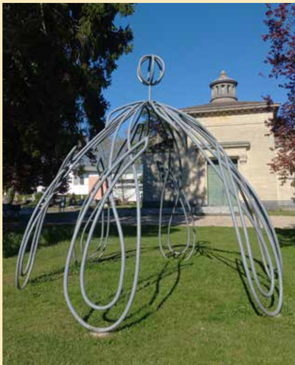
Patrice Quéreel, 6J, sculpture, devant l'ancien crématorium.

Admirateur de Duchamp, l'artiste local Patrice Quéreel imagine, quant à lui, une installation sous forme de jeu de mots. Avec ses 6 lettres J en acier, la structure rappelle la traditionnelle épithaphe « ci-gît ». Il s'agit d'une œuvre posthume, l'artiste étant mort en 2015.