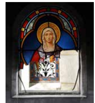
Verrière au carré E.

Concession : emplacement dans le cimetière, cédé par la commune à une famille, pour une durée variable.