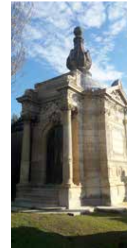
Le néo-Renaissance : inspiration du 16 e siècle avec un foisonnement de décors (végétaux, anges...) (carré M1)