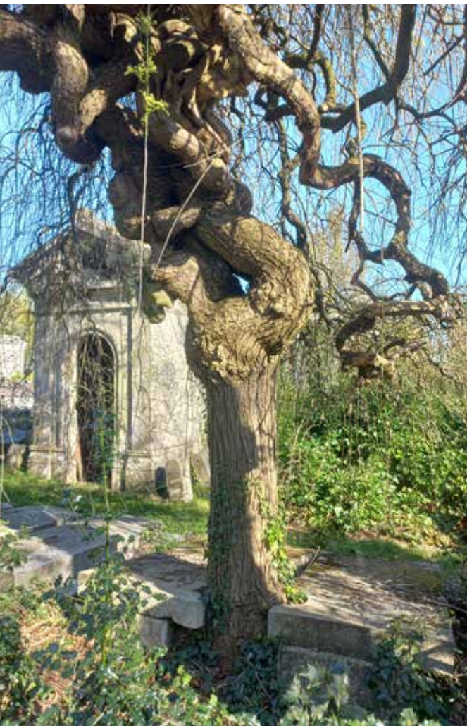
Sophara pleureur (carré E).