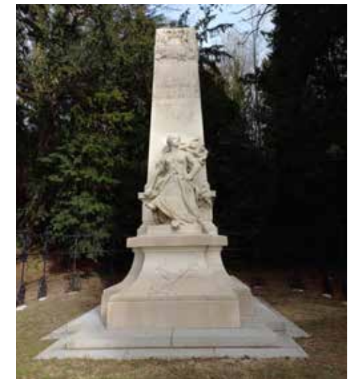
Monument au mort de la guerre 1870, entrée Sud. Sculpteurs : E. Bénéte et F. Pompon.

D'autres monuments commémorent l'histoire plus récente comme celui des rapatriés d'Afrique du Nord, érigé en 1970. (carré Y).