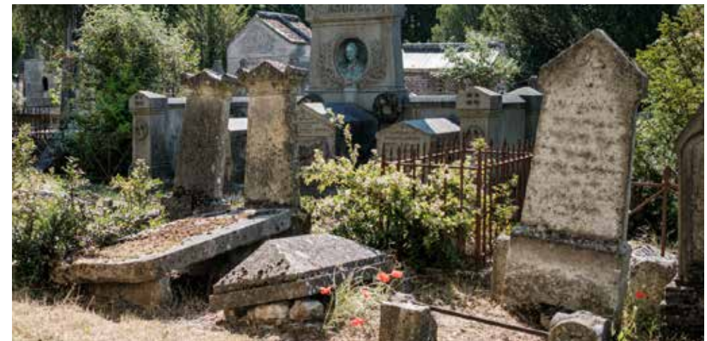
Un patrimoine fragile : carré B.

Crédits couverture : Pleureuse, Sépulture Verdrel (détail) (carré N2)