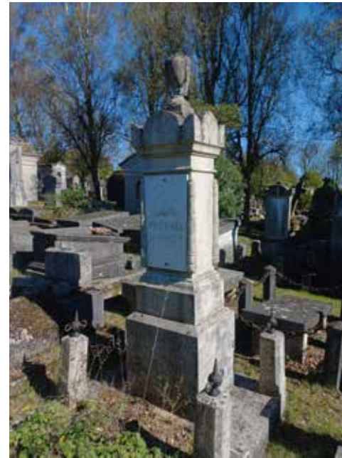
Cippe (carré C).

d'une verrière, elles sont généralement fermées d'une grille en fonte de fer ou en bronze. Après la Première Guerre mondiale, ce modèle tend à disparaître, au profit de monuments moins élevés et de plus en plus standardisés. Les carrés de l'extension nord sont caractéristiques de cette évolution.