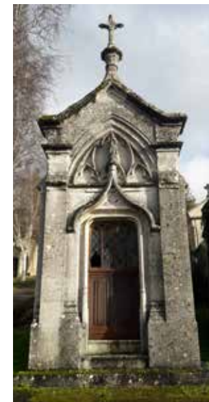
Le néo-gothique : référence aux 13 e -14 e siècles avec les arcs brisés, pinacles, crochets... (carré I2)