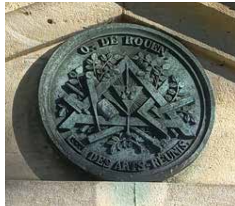
Exemple de signe d'appartenance à la franc-maçonnerie.