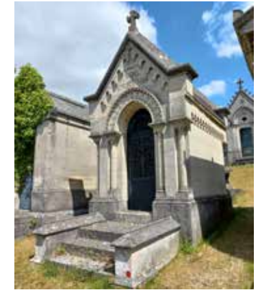
Le néo-roman : les baies cintrées, les frises et les chapiteaux sont repris du 11 e et 12 e siècles (carré M2)