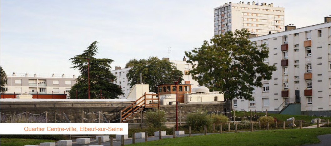
Quartier Centre-ville, Elbeuf-sur-Seine

1 500 quartiers au niveau national sont concernés afin de concentrer les efforts. Sur le territoire de la Métropole, 16 quartiers répartis sur 14 communes ont été retenus, ce qui représente près de 50 000 habitants :