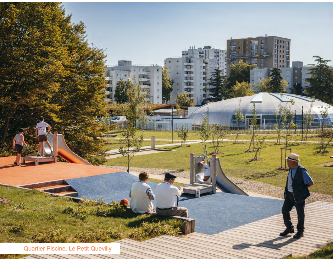
Quartier Piscine, Le Petit-Quevilly