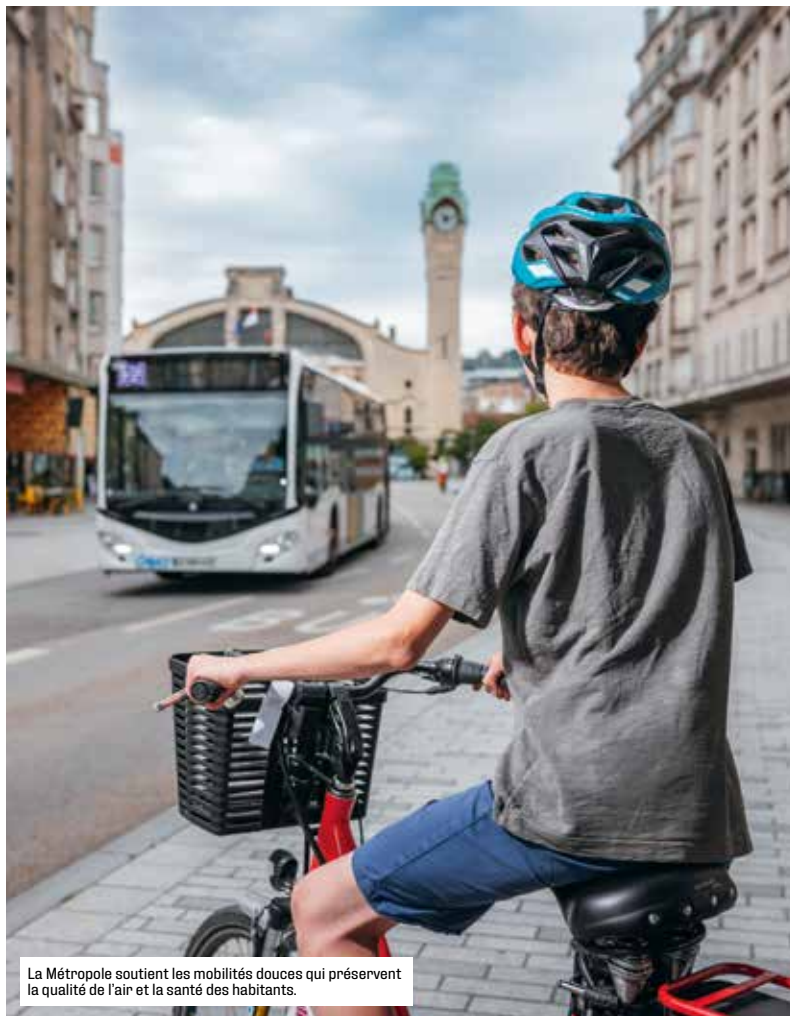
La Métropole soutient les mobilités douces qui préservent la qualité de l'air et la santé des habitants.

Malgré le contexte budgétaire, nous allons doubler le Fonds d'Aide à l'Aménagement, pour le porter à 1,4 million d'euros par an. C'est très concret : rénover une école, aménager un espace public, entretenir le patrimoine communal, poser des caméras.