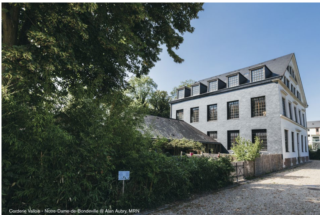
Corderie Vallois - Notre-Dame-de-Bondeville

Comme pour tout projet, la réalisation d'un diagnostic territorial est un préalable nécessaire pour bien comprendre les besoins, les pratiques et les opportunités locales.