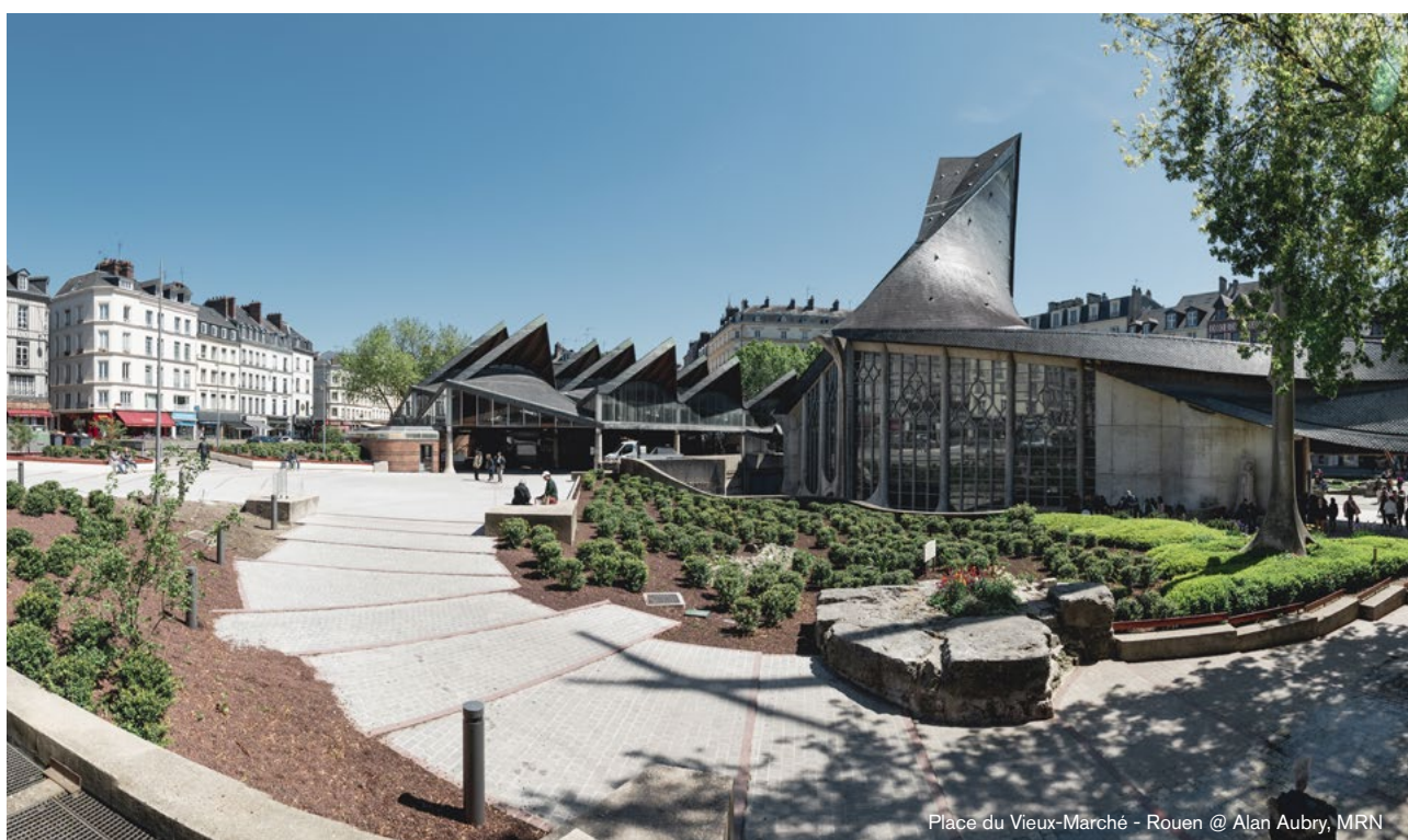
Place du Vieux-Marché - Rouen

Outre l'expérience en soi, c'est également la valeur ajoutée que le tourisme créatif apporte au territoire qu'il faut souligner. Levier de développement territorial à part entière, il favorise le tourisme hors-saison et l'allongement des séjours, diversifie l'offre et donc la demande, redynamise l'image du territoire, favorise la cohésion sociale et la résilience, dégage des retombées plus importantes pour l'économie locale en s'inscrivant pleinement dans les principes de l'économie circulaire.