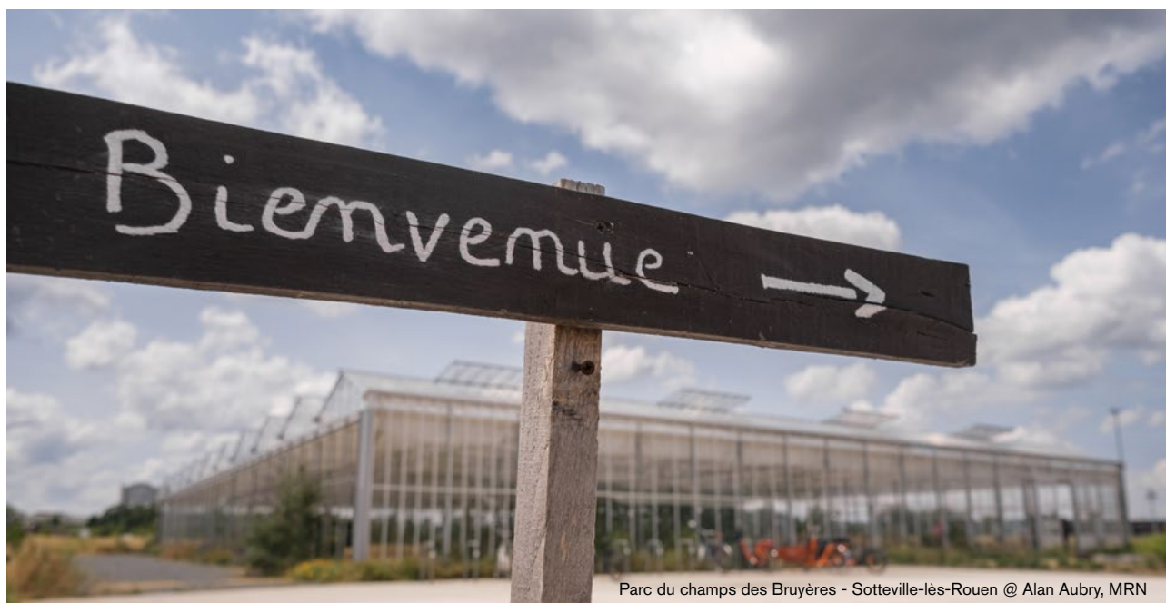
Parc du champs des Bruyères - Sotteville-lès-Rouen @ Alan Aubry, MRN

Cela peut passer par le déploiement de la marque nationale Tourisme & Handicap (les bureaux d'informations touristiques de Rouen et de Jumièges sont labellisés pour les 4 handicaps, plusieurs sites et monuments métropolitains sont également entrés dans la démarche : Muséum, 106, base de Bédanne...); mais aussi par la mise en place de dispositifs de médiation numériques (tablette avec une vidéo en LSF pour les visites guidées, contenus multimédias à la carte, audiodescription, réalité virtuelle et réalité augmentée...).