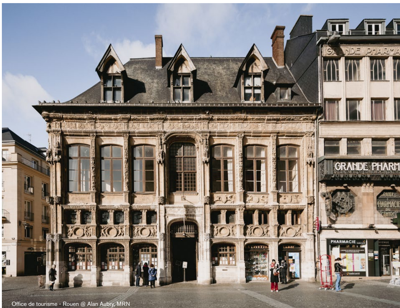
Office de tourisme - Rouen