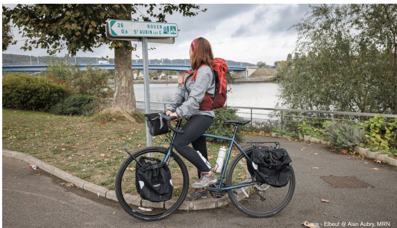
Quais - Elbeuf

Au préalable, il est primordial d'identifier les freins au développement d'une offre sans voiture : navettes, transport de bagages, vente de paniers repas par les hébergeurs, location VAE à déployer, etc, contribuent à garantir la fluidité du déplacement.