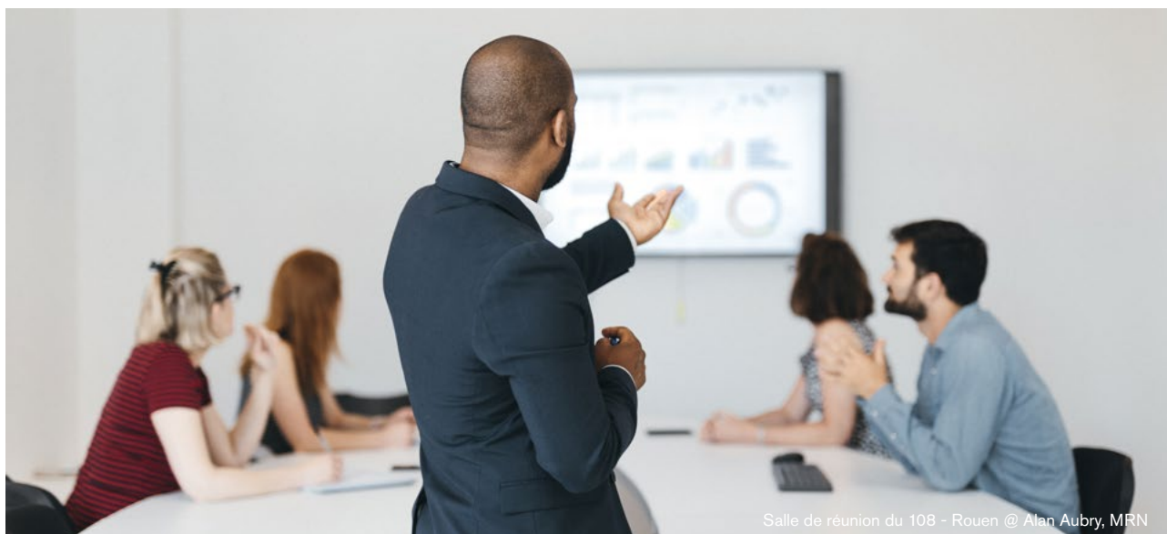
Salle de réunion du 108 - Rouen

Dans cet esprit, il convient d'élargir la notion d'accueil touristique à celle d'hospitalité, pour inclure sans distinction les résidents, les visiteurs et les voyageurs.