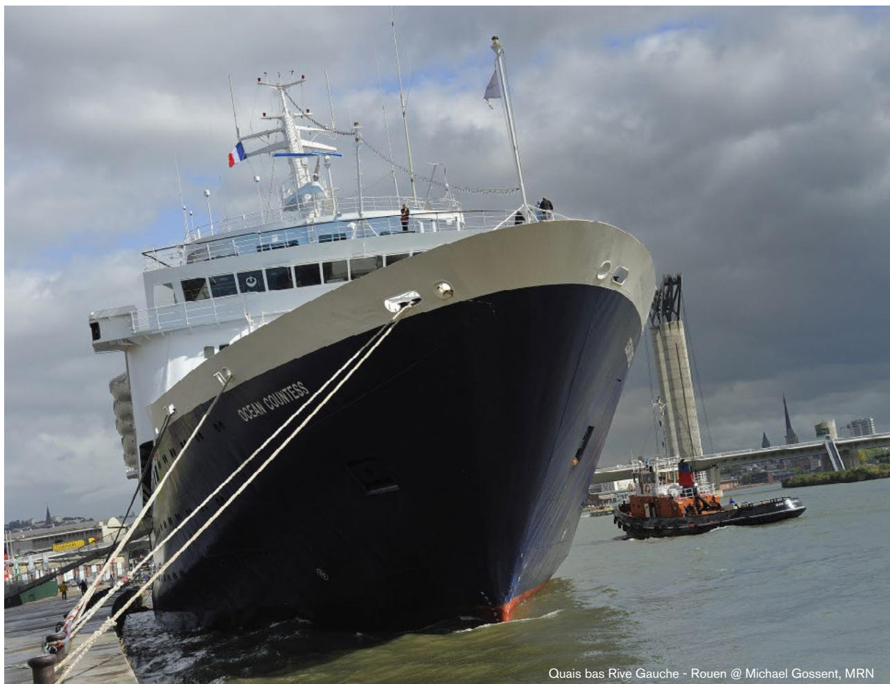
Quais bas Rive Gauche - Rouen

Cela ne signifie pas nécessairement renoncer au tourisme international. D'abord parce que Londres et Bruxelles par exemple sont à moins de 4h de trajet de Rouen, et entrent donc dans la catégorie «proximité»; ensuite parce que la clientèle internationale reste un pilier économique essentiel. En revanche, il s'agit de faire des clientèles de proximité une cible à part entière et prioritaire en termes d'allocation des ressources.