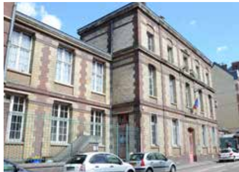
Atelier Victor Hugo

https://www.metropole-rouen-normandie.fr/sorties/patrimoine