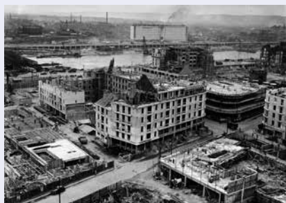
© Région Normandie - Inventaire général ; Couchaux Denis

Découvrir le système constructif poteau-poutre de l'architecture en béton en observant les immeubles de la Reconstruction. En atelier, manipulation d'une maquette.