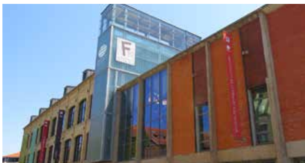
La Fabrique des savoirs